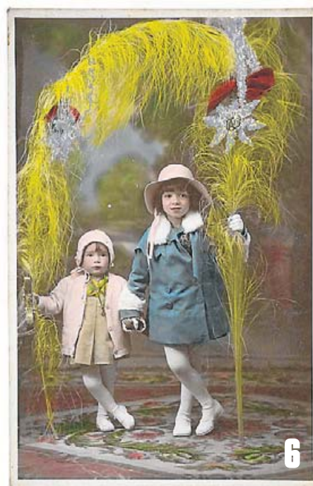
(6) Fotografia acolorida a mà de dues nenes amb palmons.